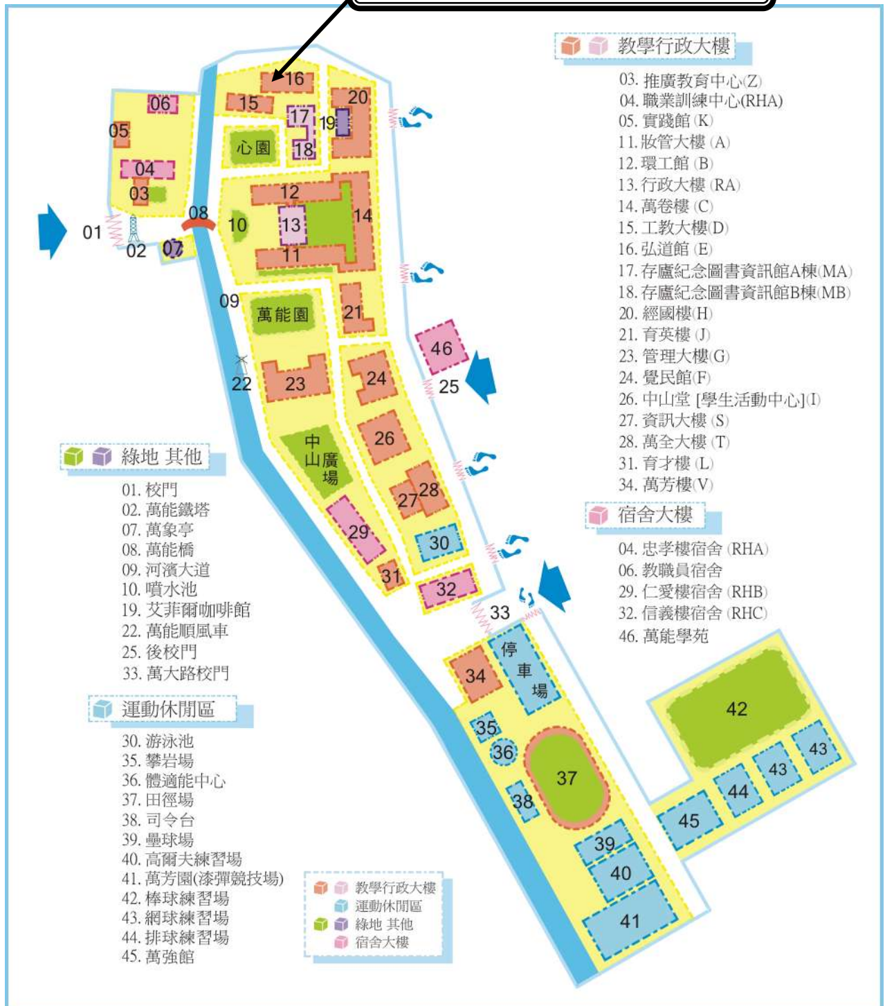
萬能科技大學校園地圖